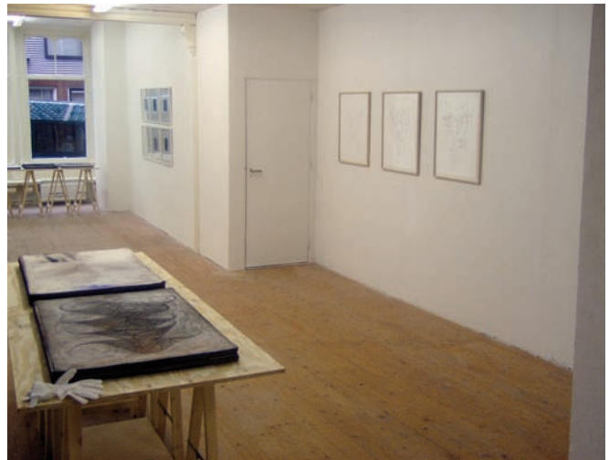
K09 december 2007