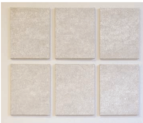
René Eicke z.t. 6 x ( 50 x 35 cm ) z.t. lak op doek 2006

Dit laatste zegt tevens iets over de overeenkomsten tussen beide kunstenaars. De optische werking van een werk in een ruimte is een essentieel onderdeel van het werk. Beide gaan verder bij het maken van een werk uit van uitgetekende patronen of grids en aan de concretisering van een werk komt geen kwast te pas. Beide zijn m.a.w. geen Terpen Tijnen met een van emotie geladen penseelstreek, hun werkwijze is eerder te vergelijken met de wijze waarop een banketbakker een slagroomtaart maakt, inclusief het gebruik van spuitzakken.