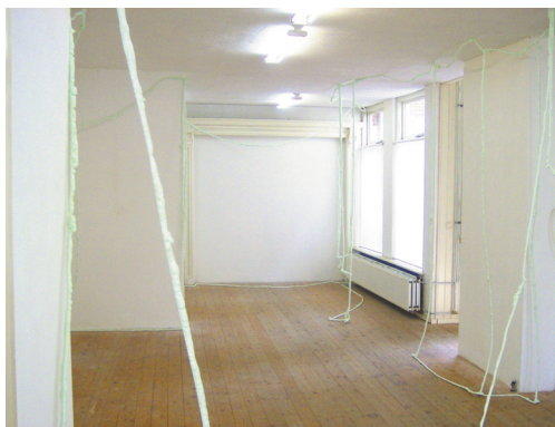
Ronald de Ceuster

De totale expositie is een spel van ruimtes en tussenruimtes en, vanwege minimaal kleurgebruik, een helder en lucide geheel. De grenzen tussen schilderen, tekenen en beeldhouwen als zelfstandige kunstuitingen worden in deze presentatie opgeheven en zijn irrelevant in het benoemen van het werk van alledrie.