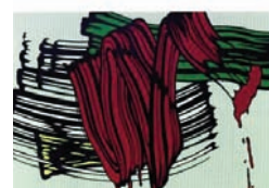
Roy Lichtenstein Big Painting no. 6

De 'tekenmachine' van Jochem van der Spek is een projectie van computergestuurd tekenen en doet ons, in de context van deze expositie, denken aan het grote (ruim 2 bij 3 meter) schilderij 'Big Painting No. 6' van Roy Lichtenstein. Het is een schilderij uit 1965, in de hoogtijdagen van het Amerikaanse Abstract Expressionisme. Op het schilderij worden een paar, op expressieve schildergebaren gebaseerde, kwaststreken op gestileerde wijze tot gigantische formaten opgeblazen. In zekere zin is dit schilderij te interpreteren als een ironisch commentaar op 'het schildergebaar' en de daaraan toegekende mystieke betekenis, van schilders als De Kooning en Pollock. Daarnaast wordt dit expressionistische gebaar, in het werk van Lichtenstein weer onderwerp voor een vorm van representatie; een afbeelding van een (fragment van) abstract schilderij. Waarmee het abstract expressionisme als het ware een deel wordt van de alledaagse werkelijkheid. Vergelijkbaar met een koekblik met een Mondriaanmotief. Kortom, een werk met meerdere lagen.