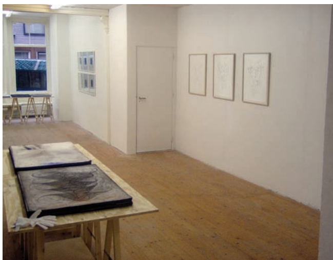
K09 december 2007