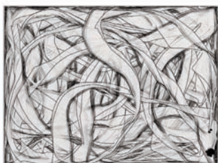
Jochem van der Spek numerieke simulatie van een tekenmachine, 2003/4 ©Jochem van der Spek

Van Altena heeft dit probleem onder tafel geschoven. Hij heeft het opgelost door het geen probleem meer te laten zijn. De tekeningen doen mee in een proces dat door hemzelf wordt aangeduid als 'een composthoop'. De tekeningen draaien mee in een grote stapel, waarbij de tekeningen ook elkaar tekenen. Soms wordt de stapel geherangschikt of worden er nieuwe vellen papier tussen gestoken.