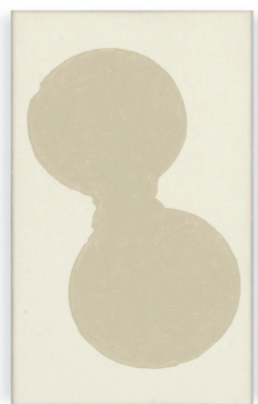
Tineke Bouma, 1985, 30 x 18 cm latex en acryl op linnen

Tineke zal het mij - denk ik - niet kwalijk nemen dat ik haar werk in verband breng met dat van Palermo. In het werk van beide zit een verwante intuïtieve sensibele en sensitiviteit. En Tineke zal het werk van Palermo zeker hebben gekend. Het bekijken van werk van Tineke Bouma en Palermo bevrijdt je voor een korte tijd van persoonlijke en maatschappelijke beslomeringen.