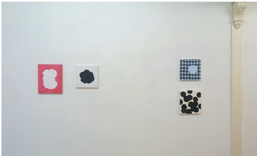
Tineke Bouma K09 februari 2011

De Groninger beeldend kunstenaar Tineke Bouma - overigens afkomstig uit Friesland - laat een klein oeuvre na dat begint in 1985 en eindigt met haar overlijden op 52-jarig leeftijd in 2009. Af en toe was werk van Tineke Bouma in Groningen te zien. En af en toe elders, zoals in - de niet meer bestaande - galerie Asselijn in Amsterdam, bij Phoebus in Rotterdam en op bijvoorbeeld de reizende tentoonstelling 'Tussenklik' over abstracte kunst in 1987.